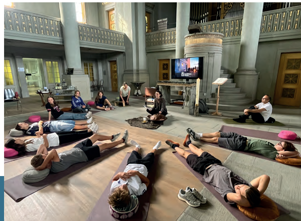
Bild: Konfirmanden Lager in Bern mit Ausflug in die Friedenskirche