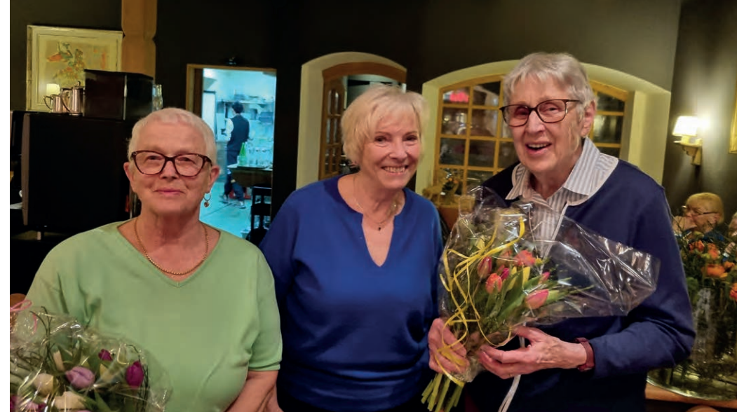
Bild: 100 Jahre Jubiläum - Einsatz Bündnerinnen in der Kirchgemeinde Davos Platz