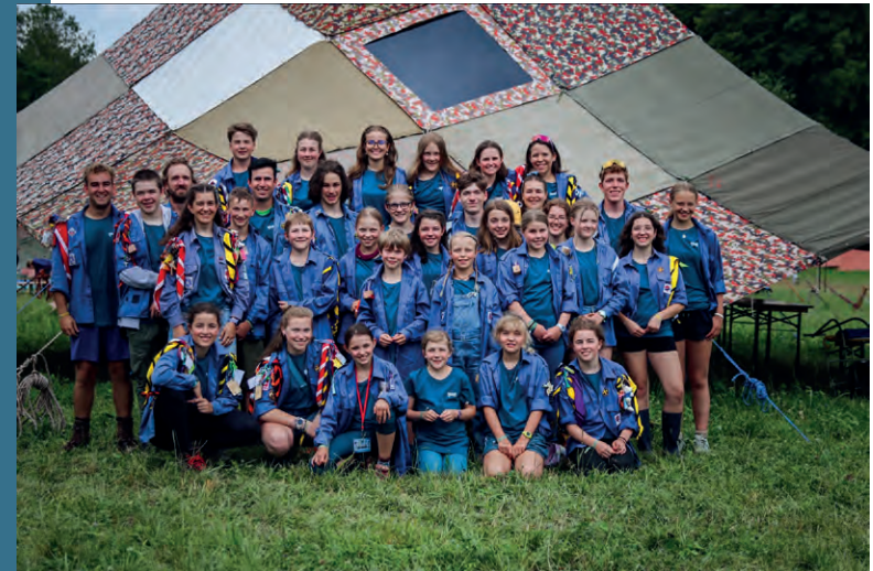
Bild: CEVI Sommerlager in Tschierv

Mein Dank gilt allen Mitarbeitenden im Bereich Kinder und Jugend sowie den Freiwilligen.