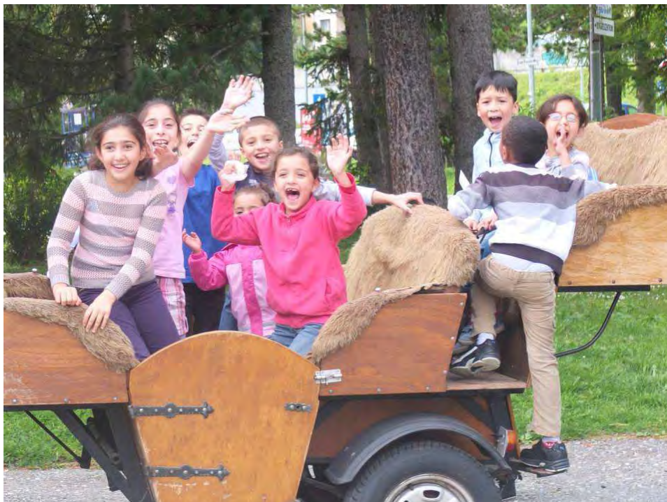
Geländespiel im Auffahrtslager 2014

So blicken wir auf ein ereignisreiches Jahr 2014 zurück und dürfen uns bereits auf viele tolle Erlebnisse im bevorstehenden Jahr freuen: Sei dies am CEVI-Tag im März, im Pfingstlager, das wir dieses Jahr in Lantsch/Lenz verbringen werden, oder im Zeltlager im Sommer!