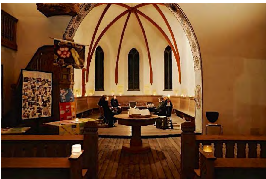
Schweigen und Beten

Schweigen bedeutet nicht, nichts zu sagen. Im Schweigen vor Gott liegt eine grosse Kraft und Verheissung: "Je stiller ich schweige, umso lauter rufe ich – erhöre mein Schweigen, o Gott" (nach Mechthild von Magdeburg, 13.Jh.).