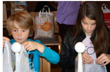
Kinder beim Basteln in der Adventswerkstatt

Die Adventswerkstatt soll den Kindern die Möglichkeit und den Raum bieten zum Basteln, so dass nur ein kleiner Unkostenbeitrag für das Material verlangt wird. Durch den Überschuss und die Einnahmen der Kaffeestube, Mittagessen und den Hundewagenfahrten konnten CHF 1'264.60 Spenden je zur Hälfte an Kinder- und Jugendprojekte der mission21 in Afrika und das Kinderhospiz Schweiz einbezahlt werden.