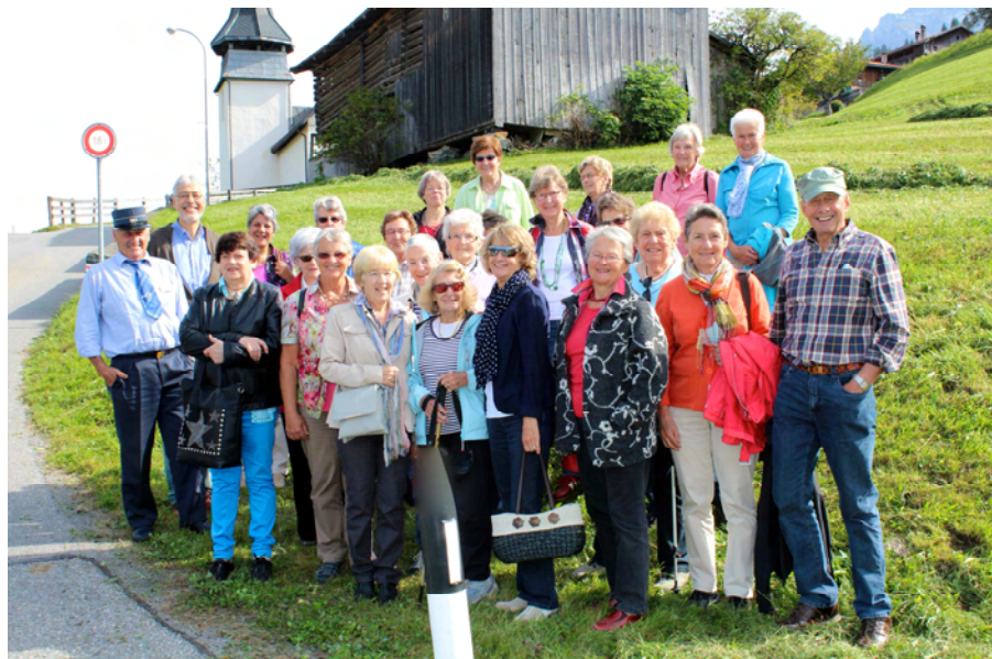
Kreis- und Kaffeefrauen

„Jedem Anfang wohnt ein Zauber inne, der uns beschützt und der uns hilft zu leben!“ (Hermann Hesse) - und so freuen wir uns einfach auf Anlässe und Projekte in den kommenden Monaten, die uns die Möglichkeit geben, in die Kirchgemeinde und die Bündner Landeskirche hinein zu wachsen und uns hier allmählich zu verwurzeln: Wir freuen uns auf Ostern, weil es schön ist miteinander das von Gott geschenkte Leben zu feiern. Wir freuen uns auf Begegnungen bei der Gemeindefreizeit in Meran. Wir sind neugierig gespannt auf das Konf-Lager in Magliaso und die anschließenden Festgottesdienste für die Jugendlichen an Pfingsten. Wir wollen uns einbringen, wenn unsere tschechische Partnergemeinde zu Besuch kommt. Wir freuen uns auf den kollegialen Austausch auf der Synode im Bergell. Und vielleicht noch wichtiger als all dies Genannte: wir freuen uns einfach auf die Menschen hier in der Kirchgemeinde – auf die, die wir in irgendeiner Weise begleiten dürfen und auf die, mit denen wir zukünftig zusammenarbeiten werden.