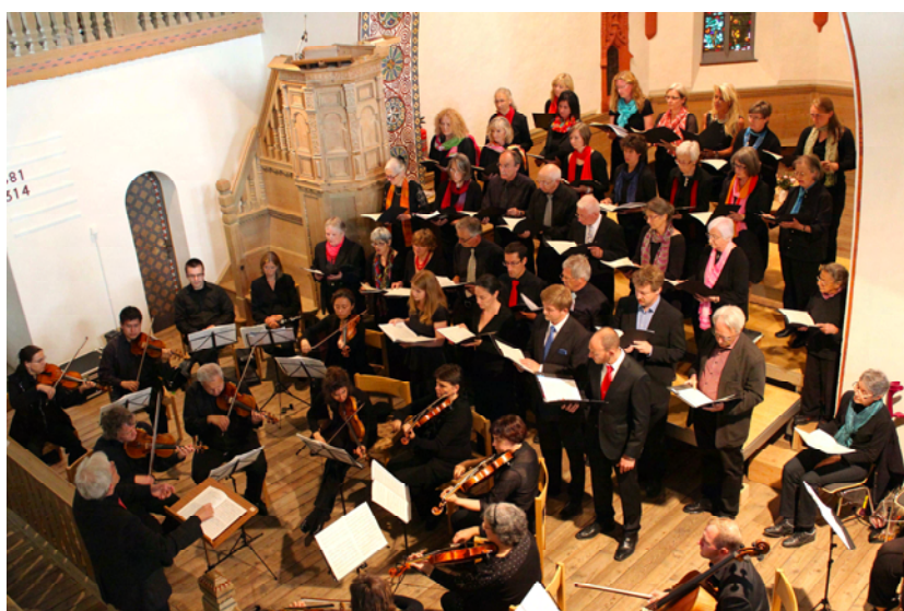
Chor St. Johann