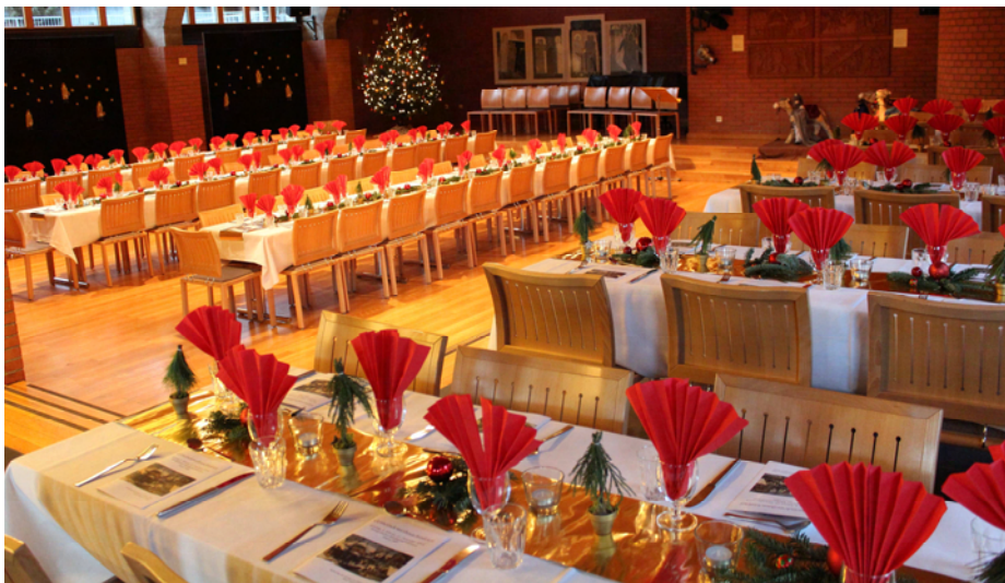
Festlich gedeckte Tische