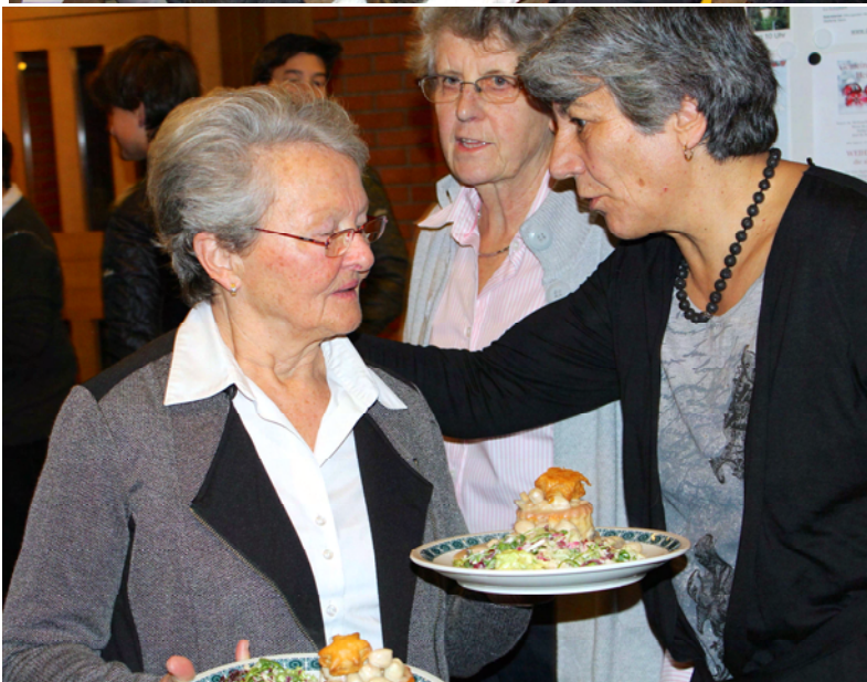
Die treuen Kreishelferinnen