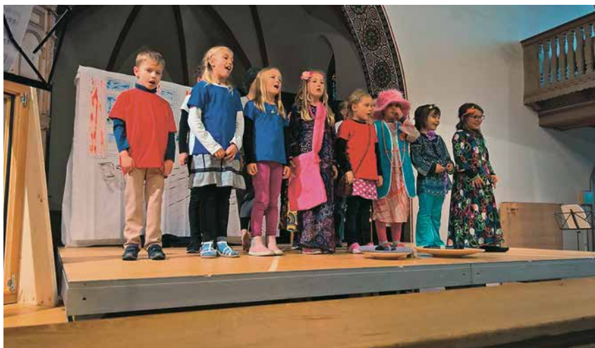
Kindermusical „Vorhang uuf für Zwingli“

Am Nachmittag wurde in der Kirche St. Johann das Kindermusical „Vorhang uuf für Zwingli“ aufgeführt. Die Kinder erhielten zu Recht grossen Beifall für ihre Leistungen. Beim Festgottesdienst, wie auch beim Musical, war die Kirche bis fast auf den letzten Platz besetzt. Das Reformationsfestival war ein sehr schöner, besinnlicher und festlicher Anlass. An dieser Stelle ein herzliches Dankeschön allen, die zum guten Gelingen beigetragen haben.