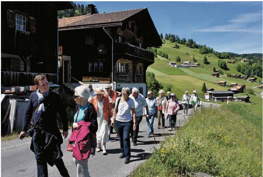
Gemeindeausflug nach Furna