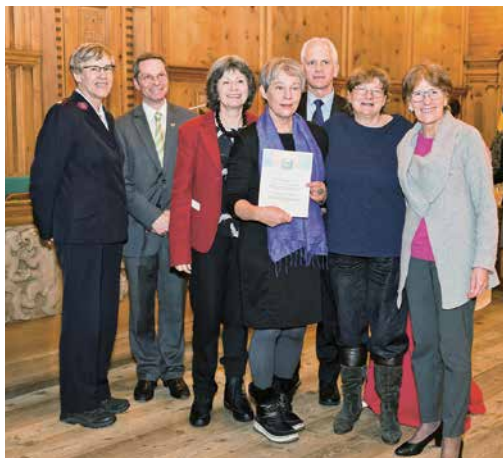
Preisverleihung Oecumenica – Label AKiD

Das Vorbereitungsteam von „Schweigen und Beten“ ist sehr motiviert, mit neuem Schwung die Gebetsreihe auch im Jahr 2019 fortzusetzen.