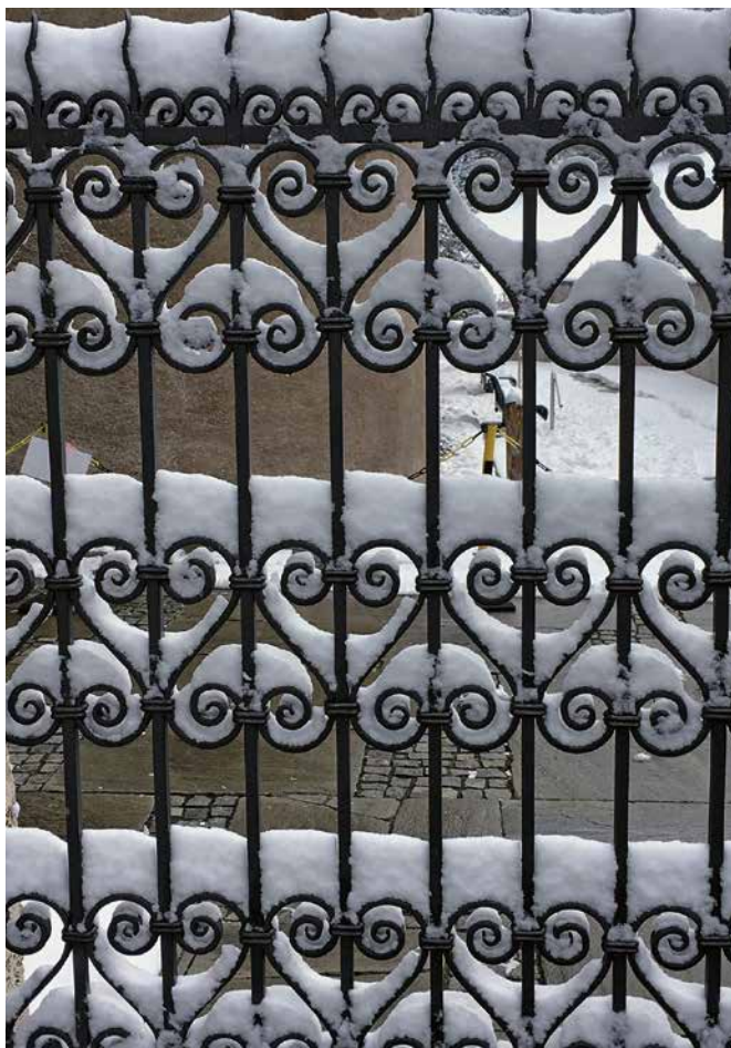
Winterstimmung am Eingangstor der Kirche St. Johann

In den täglichen Meditationen gingen die Teilnehmenden zu Hause ihren ganz persönlichen Fragen nach. In den wöchentlichen Gruppentreffen half der Austausch mit den anderen Teilnehmenden, diesen persönlichen Weg im Gespräch zu reflektieren und zu vertiefen.