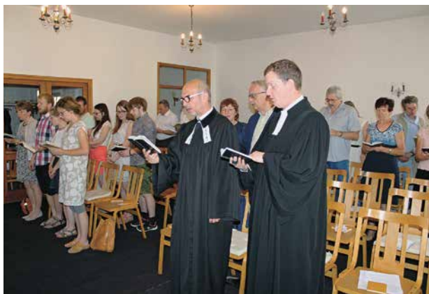
Abschiedsgottesdienst in Kroměříž

Mir wurde auf dieser Reise vor Augen geführt, wie wichtig es ist, mit anderen Christinnen und Christen auf der Welt vernetzt zu sein. Darum möchte ich mich mit anderen zusammen in den nächsten Jahren bemühen. Ich denke, für unsere Kirchgemeinde Davos Platz ist es wichtig, über den eigenen Tellerrand hinaus zu schauen.