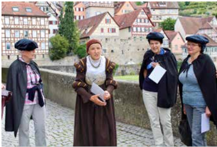
Reise zu den Reformationsstädten in Süd-Deutschland