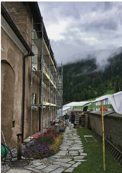
Sanierung der Friedhofsmauer sowie der Fassade

Am 16. Dezember liessen wir dann das Jahr mit unserer traditionellen Adventsfeier ausklingen. Erfolgreich halfen wir dem Samichlaus, seinen Esel wiederzufinden und wurden dafür mit warmem Punsch und selbstgemachten Guetzi belohnt.