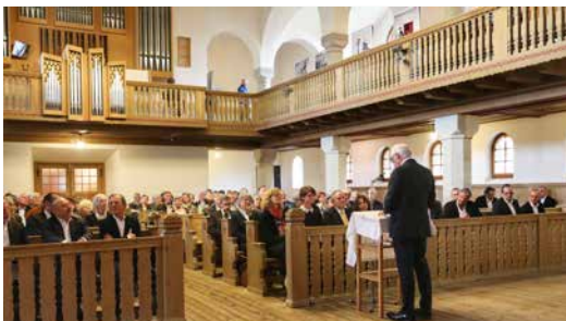
150 Jahre Gleichberechtigung Schweizer Juden