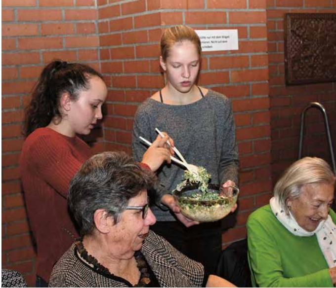
Einsatz der Konfirmandinnen an der Adventsfeier