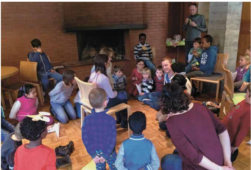
„Chind“ am Cheminée