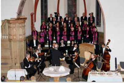
„Gott der Herr ist Sonn und Schild“ J.S Bach