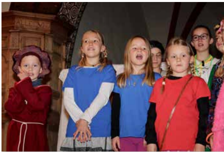
„Vorhang uuf für Zwingli“