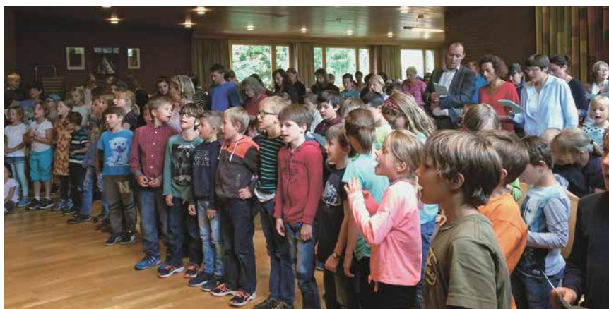
Schulschlussfeier im evangelischen Kirchgemeindehaus