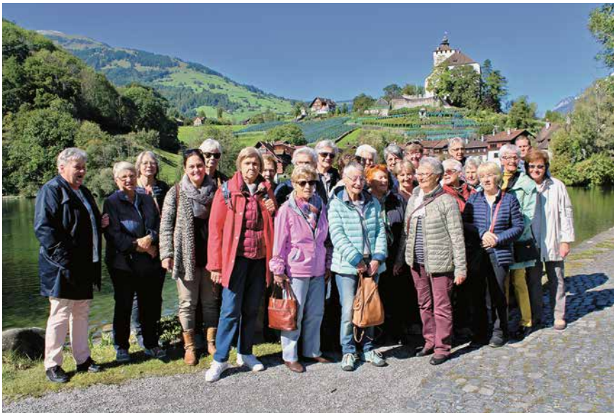
Kreishelferinnen und Kaffeefrauen beim Ausflug nach Werdenberg

Unseren Slogan „Gemeinsam schmeckt's besser“ erleben wir immer am zweiten Dienstag des Monats.