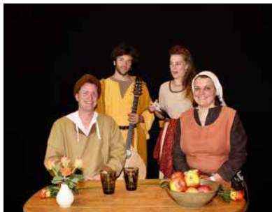
Davos sucht einen Pfarrer