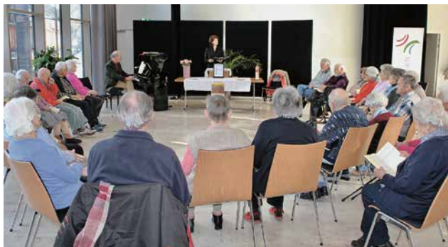
Gottesdienst im AZG

Das im Kolloquium gemeinsam vorbereitete Jubiläumsjahr hat ergeben, dass einige Veranstaltungen als regionale weitergeführt werden sollen. So beispielsweise der Reformationssonntag Anfang November mit einem gemeinsamen Gottesdienst, nachdem der Festivalsonntag am 29. Oktober 2017 in Davos Platz von vielen Mitgliedern aus dem ganzen Kolloquium besucht worden war.