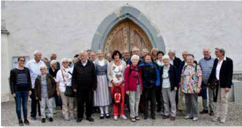
Auffahrtsausflug Reformationsstadt Ilanz