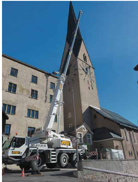
Montage des neuen Klöppels