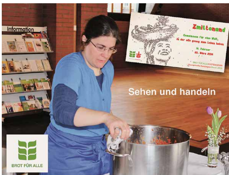
Unsere Sozialdiakonin im Einsatz