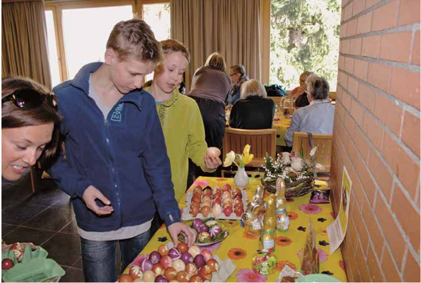
Gründonnerstag – Eierfärben im KGH