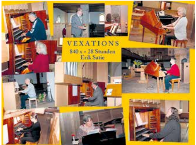
840 x = 28 Stunden