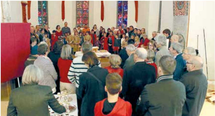
Einführung ins Abendmahl

Der Religionsunterricht an den beiden Talentklassen wird ebenfalls von unserer Kirchgemeinde verantwortet. Da dieser nicht in einer wöchentlichen Lektion stattfinden kann, sind wir im Gespräch mit der Schulleitung und den anderen Kirchgemeinden und am Ausprobieren von pragmatischen Lösungen.