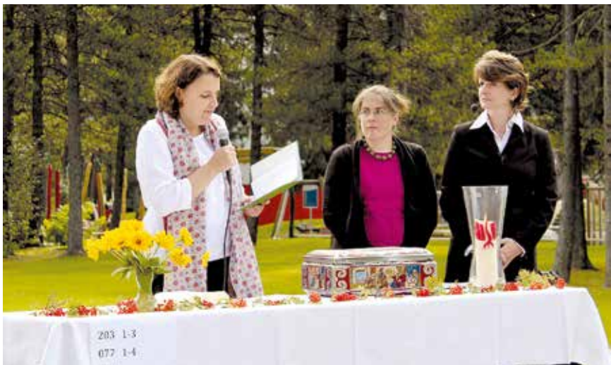
Pfarrfrauenteam und Sozialdiakonin

Mehr zu unseren weiteren Anlässen und Aktivitäten erfahren Sie im Inneren dieses Jahresberichts. Wir sind überzeugt, dass wir mit unseren vielfältigen Angeboten auch Ihr Interesse wecken können. Wenn Sie Zeit und Lust haben, freuen wir uns sehr über Ihre Teilnahme.