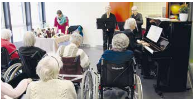
GD im Pflegeheim

Die grosszügige Kollekte von Fr. 604.00 wird philippinischen Frauen helfen, sich selber zu helfen – mit Berufsausbildungen in ökologischer Landwirtschaft, als Schneiderin und hilft, die Rechtsberatung für ausgebeutete Frauen auszubauen. Beim anschliessenden Zusammensein mit Getränken und verschiedenen philippinischen Spezialitäten blieb Zeit für Austausch und Gespräch.