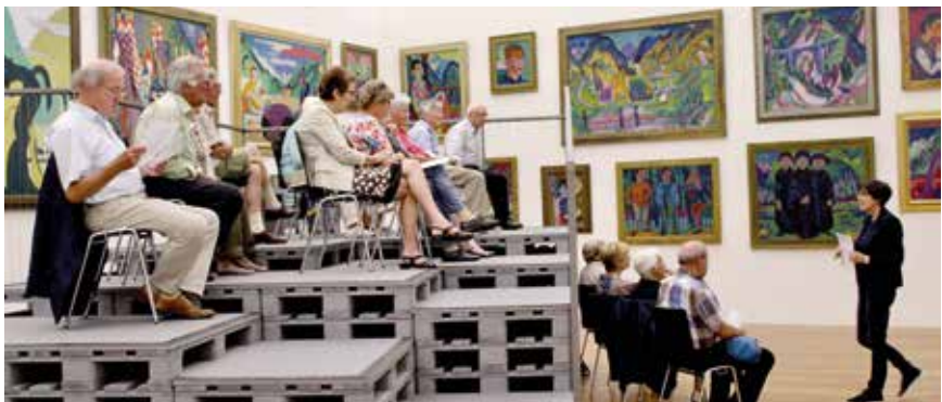
Kunstgeschichte im Kirchner Museum

Aber wie gesagt, das ist noch in Arbeit. Wir haben auch festgestellt, dass wir doch auch an unsere Grenzen stossen, was die Zeitressourcen betreffen.