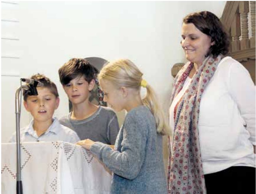
Lektorinnen und Lektoren