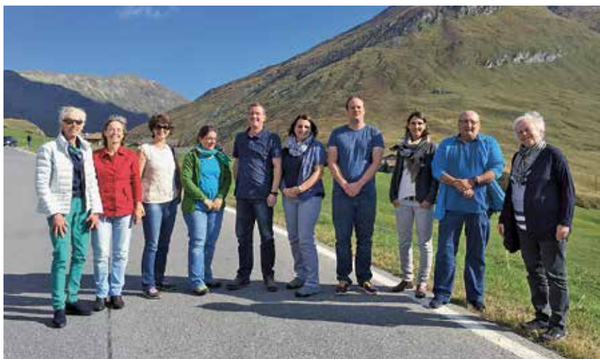
Tagessitzung im Avers

Per 31.12.2016 weist die Hilfskasse ein Vermögen von CHF 29'635.64 aus.