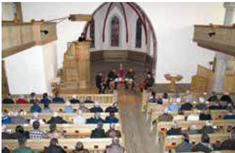
Gottesdienst am Karfreitag

Im September 2016 besuchte ich eine fünftägige Weiterbildung in Bingen (D), mit dem Thema „Frauenwege – Seelsorge und Kunst“.