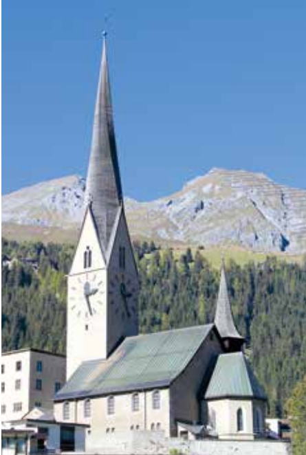
Kirche St. Johann